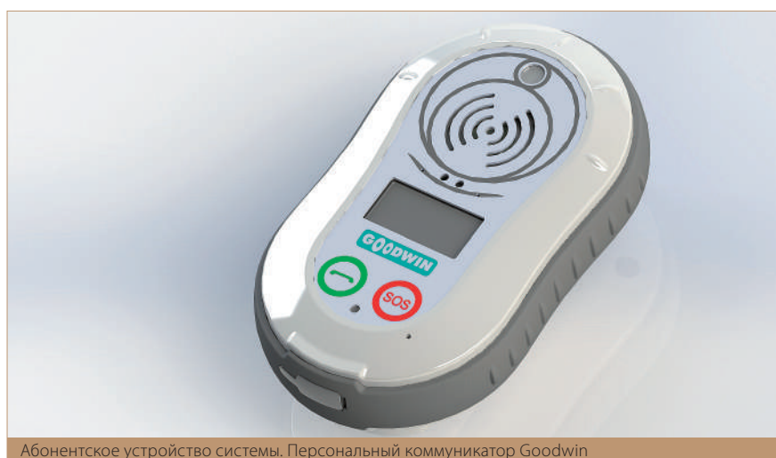
Абонентское устройство системы. Персональный коммуникатор Goodwin

— По опыту реализации как собственного проекта компании, так и клиентских проектов, можно уже сейчас говорить о возможном экономическом эффекте от применения данной системы. Приведу конкретный пример. После анализа полученных за месяц наблюдений о том, сколько человек работают на каждом конкретном участке, как часто работники уходят на «перекур» и покидают